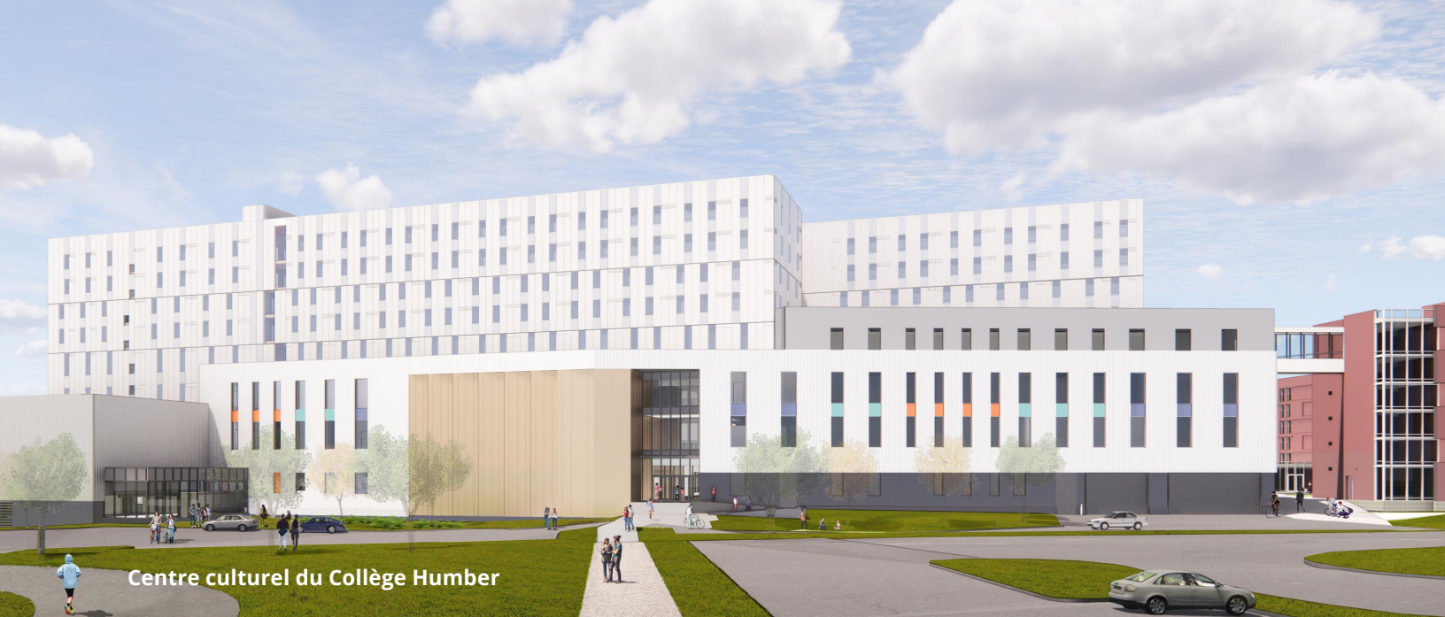
Centre culturel du Collège Humber