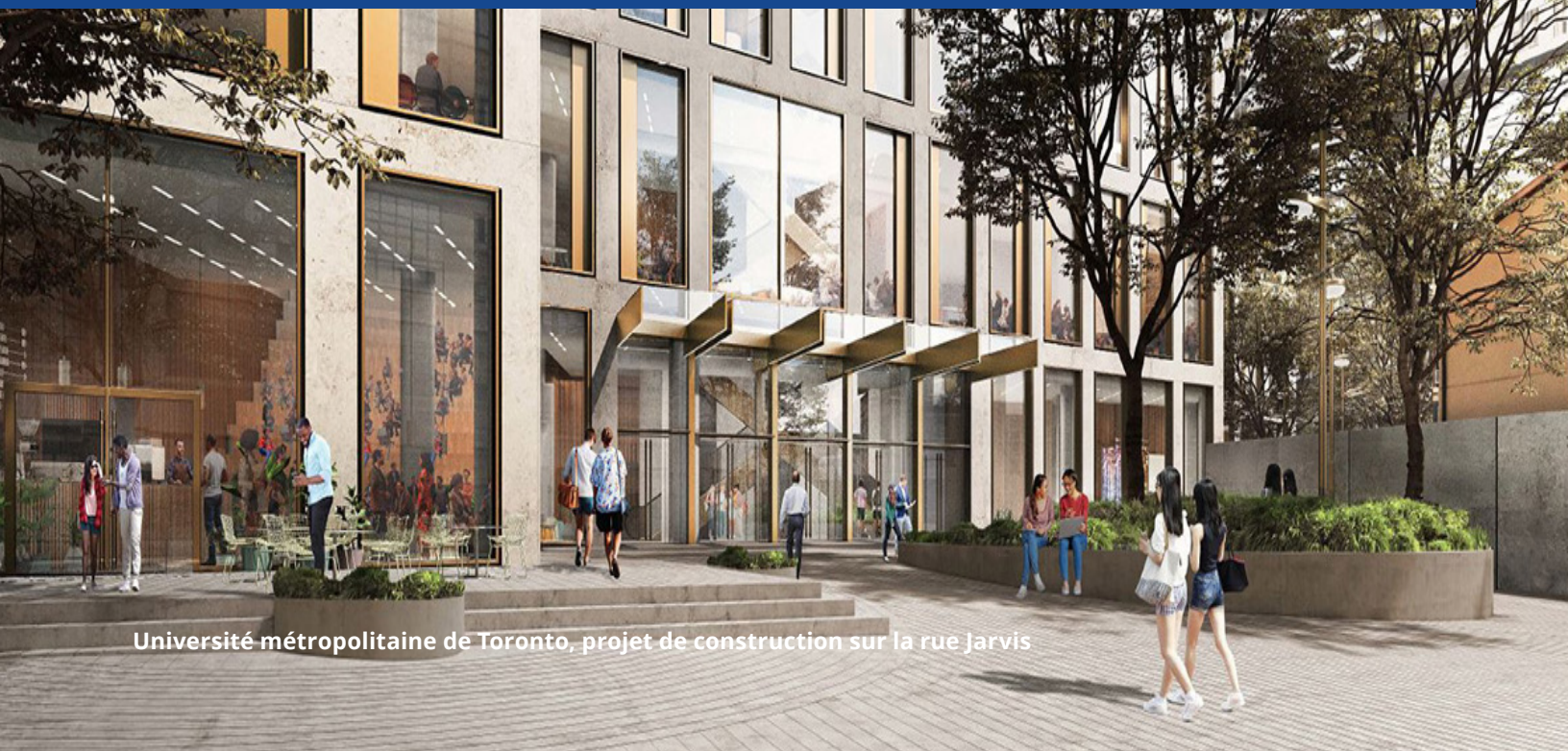
Université métropolitaine de Toronto, projet de construction sur la rue Jarvis